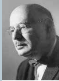
Rudolf Dreikurs (1897-1972), Psychiater und Schüler von Alfred

Er stellte das Verständnis vom Verhalten des Menschen und seiner Motivation auf eine völlig neue Grundlage. Adler sieht den Menschen als soziales Wesen, wobei er von der Gleichwertigkeit aller Menschen ausgeht. Der Mensch ist nicht Produkt von Vererbung oder Umwelt, sondern selbstbestimmt und zielgerichtet.