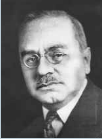
Alfred Adler (1870-1937), prakt. Arzt und knapp

10 Jahre Mitarbeiter des Freud-Kreises, gilt als Begründer der Individualpsychologie.